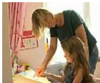
Einschulung: Umgewöhnung in den erst...