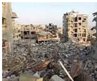
Verhandlungen in Kairo: Ringen um Waffenruhe in ...