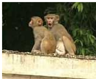
Mit Affengebrüll: Menschen gegen Affe in Neu Delhi